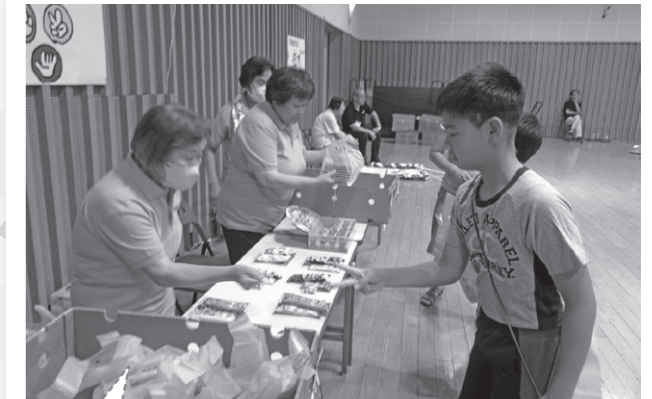
民生児童委員さんと、「じゃんけんぽんっ！」 勝ったらおまけ付きだよ

島根の社協 活動情報発信サイト「しまそこ」に 「社協ふれあい子どもまつり」の様子が掲載されました！ 県内20の社会福祉協議会の合同ウェブサイト「しまそこ！」です☆