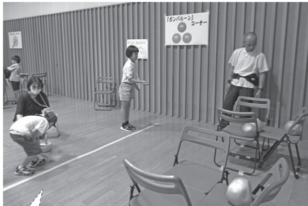
ガンバル〜ンボールを投げて、ボールが椅子の 上に乗ったらゲームクリア〜！