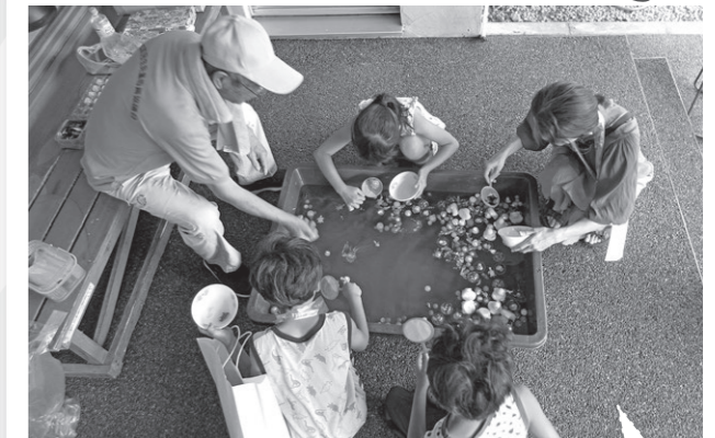
ピカピカ光る金魚を狙って…！ 可愛いアヒルもプカプカ浮いているよ〜