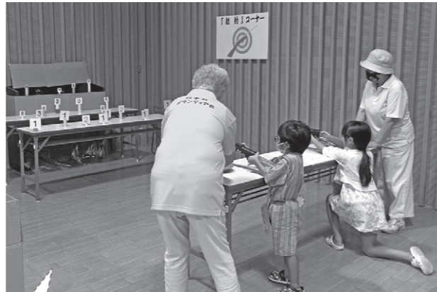
数字が書いてある的を狙って…。 合計得点で景品がもらえるよ！