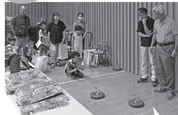
いざ、勝負！ カーリングの室内版を体験しました