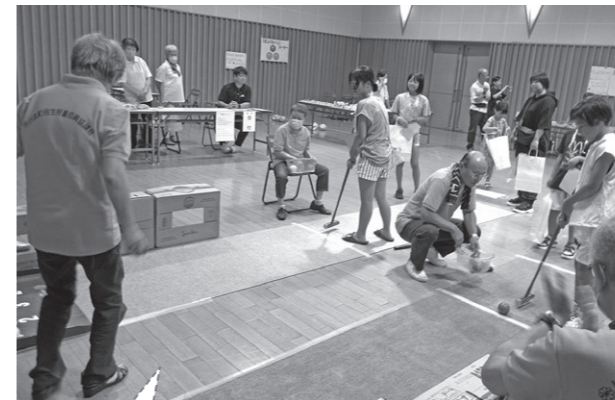
ボールをスティックで打って、得点穴に入れるゲーム。 打つ時に、「カコーン！」と良い音がしていました♪