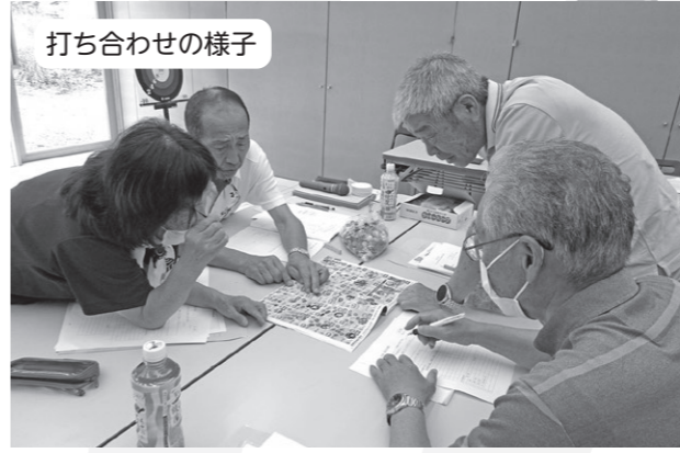
打ち合わせの様子