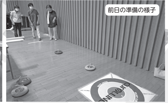
前日の準備の様子

「今年はどんなゲームコーナーにしようか？」「小学生が喜ぶ景品かあ…、悩むなあ〜」と、 事前の打ち合わせから準備まで、バッチリな民生児童委員の皆さんです！