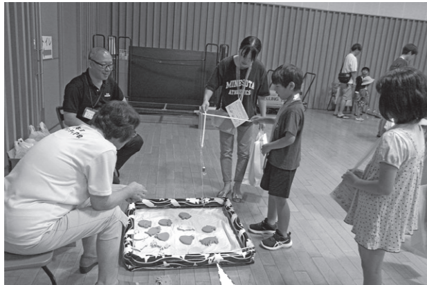
社協子どもまつりと言えば、コレです！ 魚を釣って、お菓子をゲット♪